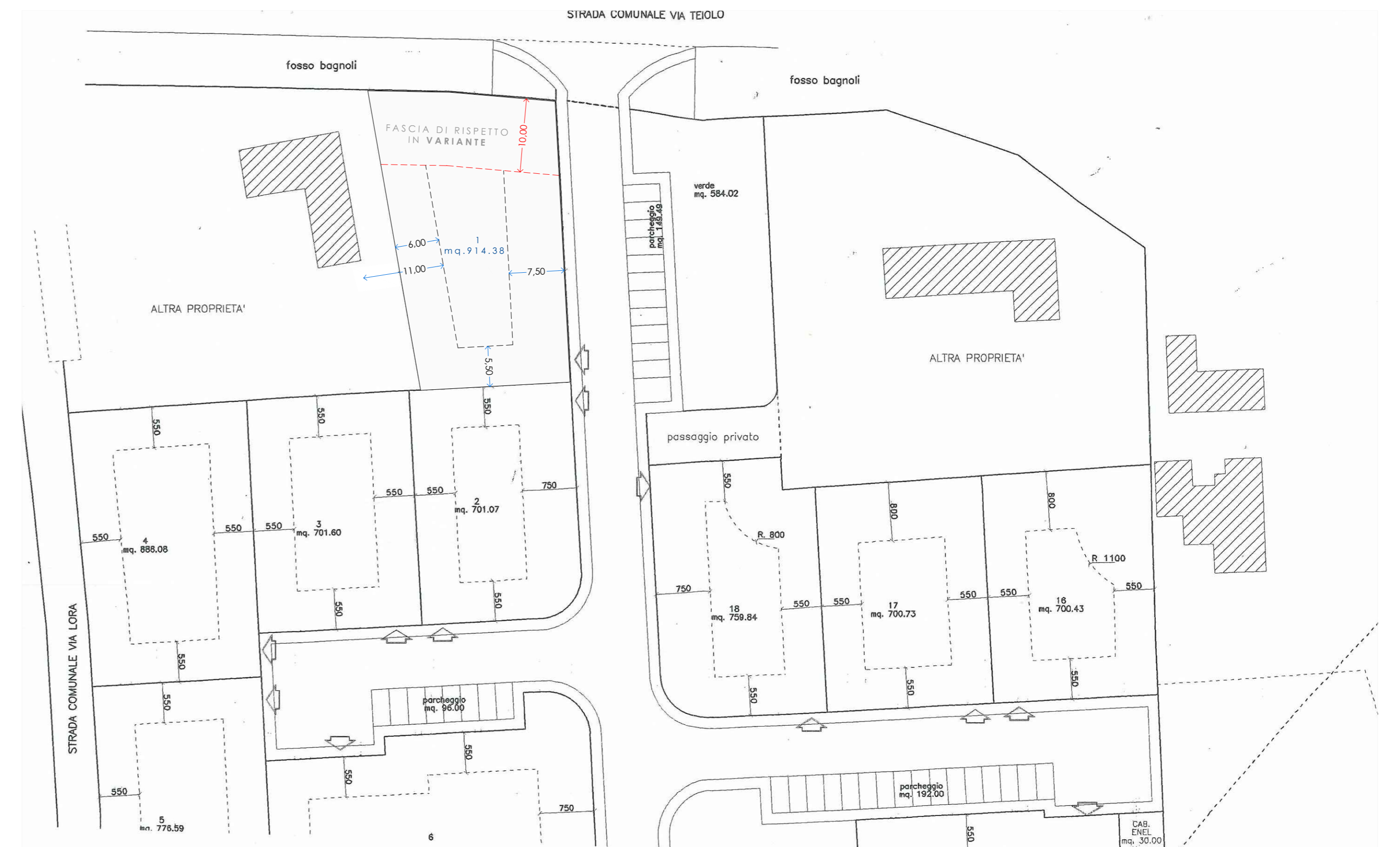
INGRANDIMENTO PLANIMETRICO PUA N. 5