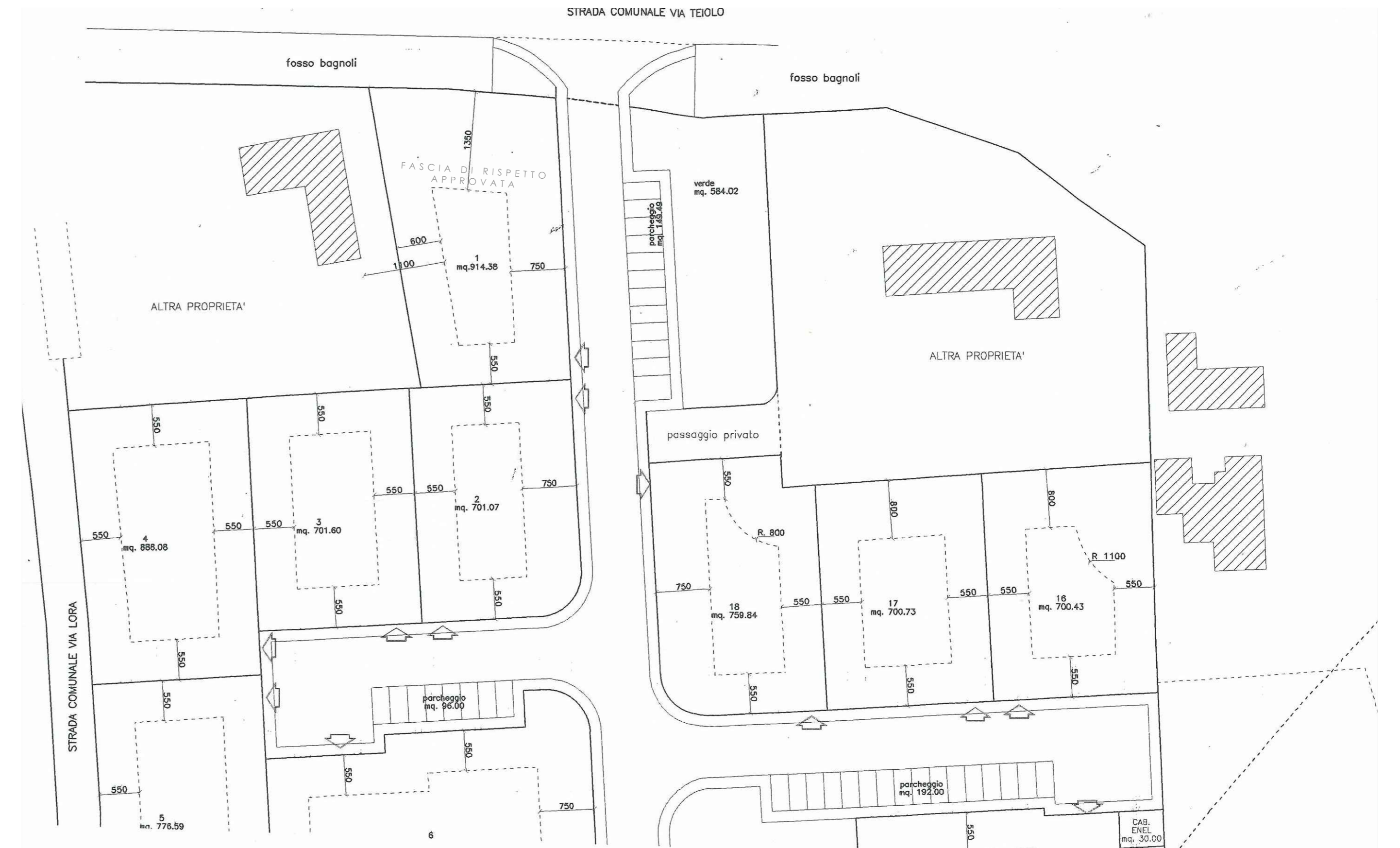
INGRANDIMENTO PLANIMETRICO PUA N. 5

DELIBERAZIONE DI C.C. N. 37 DEL 28.11.2001